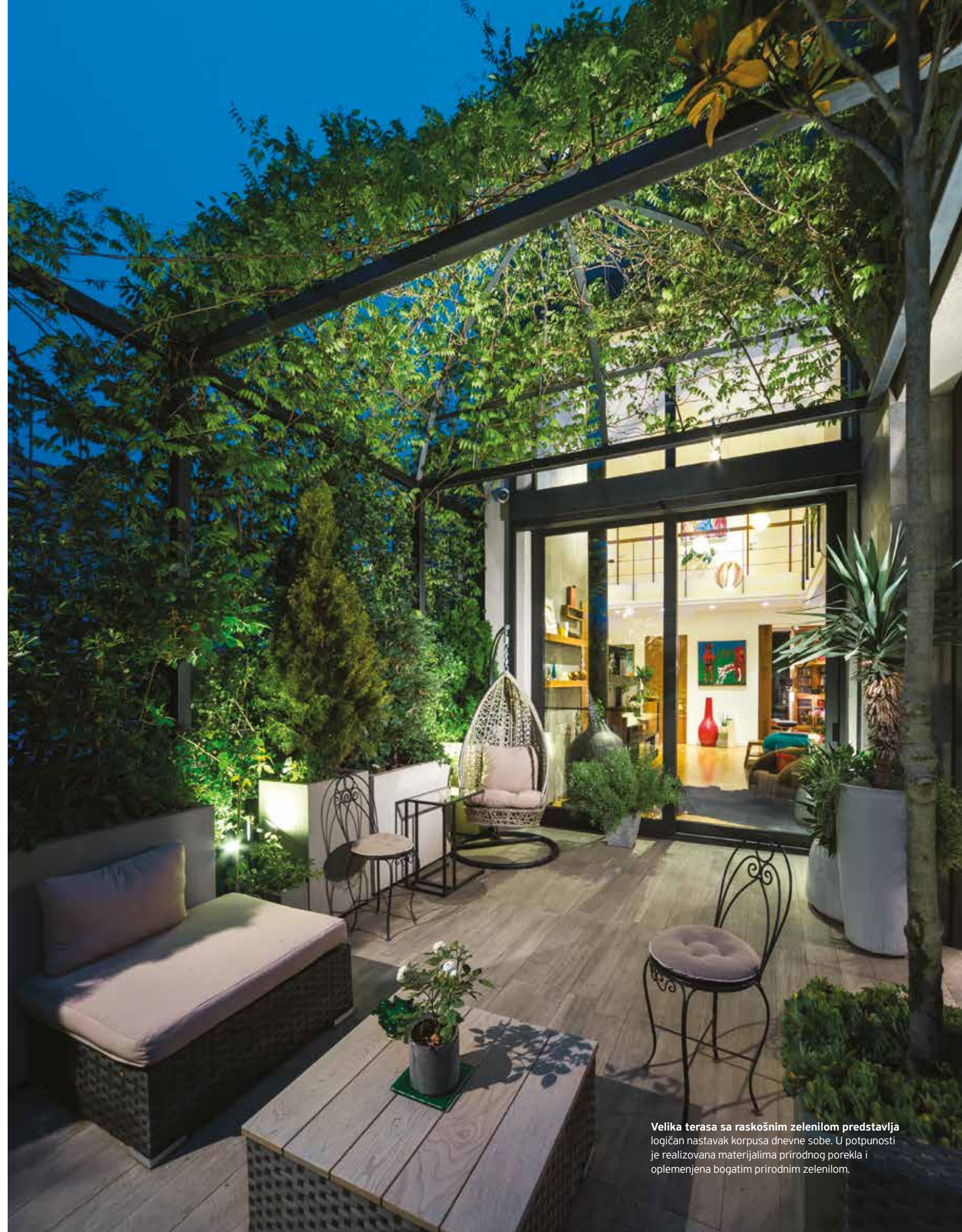
Velika terasa sa raskošnim zelenilom predstavlja logičan nastavak korpusa dnevne sobe. U potpunosti je realizovana materijalima prirodnog porekla i oplemenjena bogatim prirodnim zelenilom.