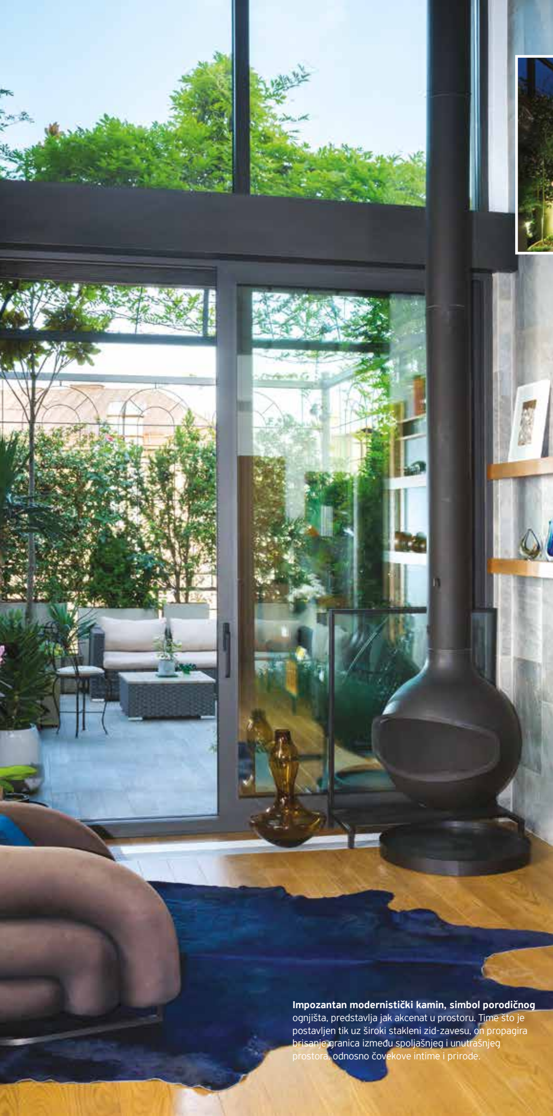
Impozantan modernistički kamin, simbol porodičnog ognjišta, predstavlja jak akcent u prostoru. Time što je postavljen tik uz široki stakleni zid-zavesu, on propagira brisanje granica između spoljašnjeg i unutrašnjeg prostora, odnosno čovekove intime i prirode.