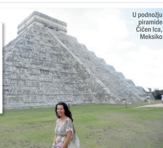
U podnožju piramide Čičen Ica, Meksiko